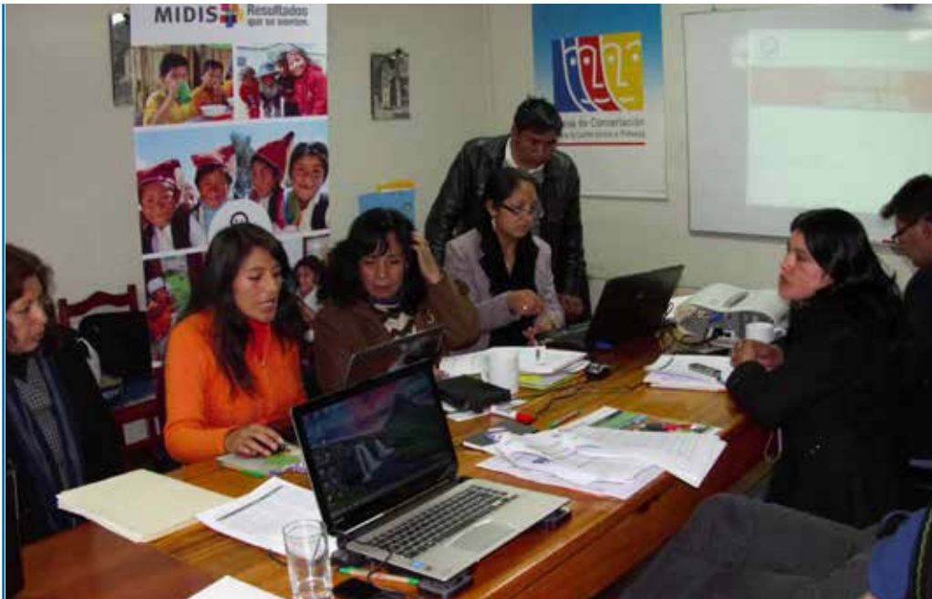
Reunión de trabajo del Grupo de Seguimiento Concertado al PELA en la MCLCP

El enfoque más importante del trabajo de la MCLCP es el del desarrollo humano y de derechos, con prioridad de atención a la niñez huancavelicana, para lo cual se han desarrollado múltiples acciones, como las campañas del Buen Trato a la Niñez y Un Millón de Amigos. Algunos de los procesos más recientes en los que la MCLCP se ha involucrado activamente fueron las veedurías al proceso de compras del Programa Nacional de Alimentación Escolar Qali Warma (PNAE QW) y la Campaña de Buen Inicio del Año Escolar (CBIAE).