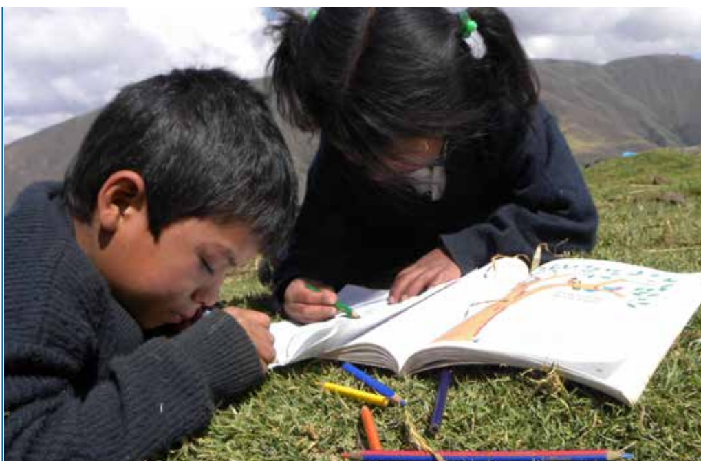
La veeduría contribuye a que los niños y las niñas de Huancavelica tengan un buen año escolar

Representante de una ONG en el Grupo de Seguimiento Concertado al PELA