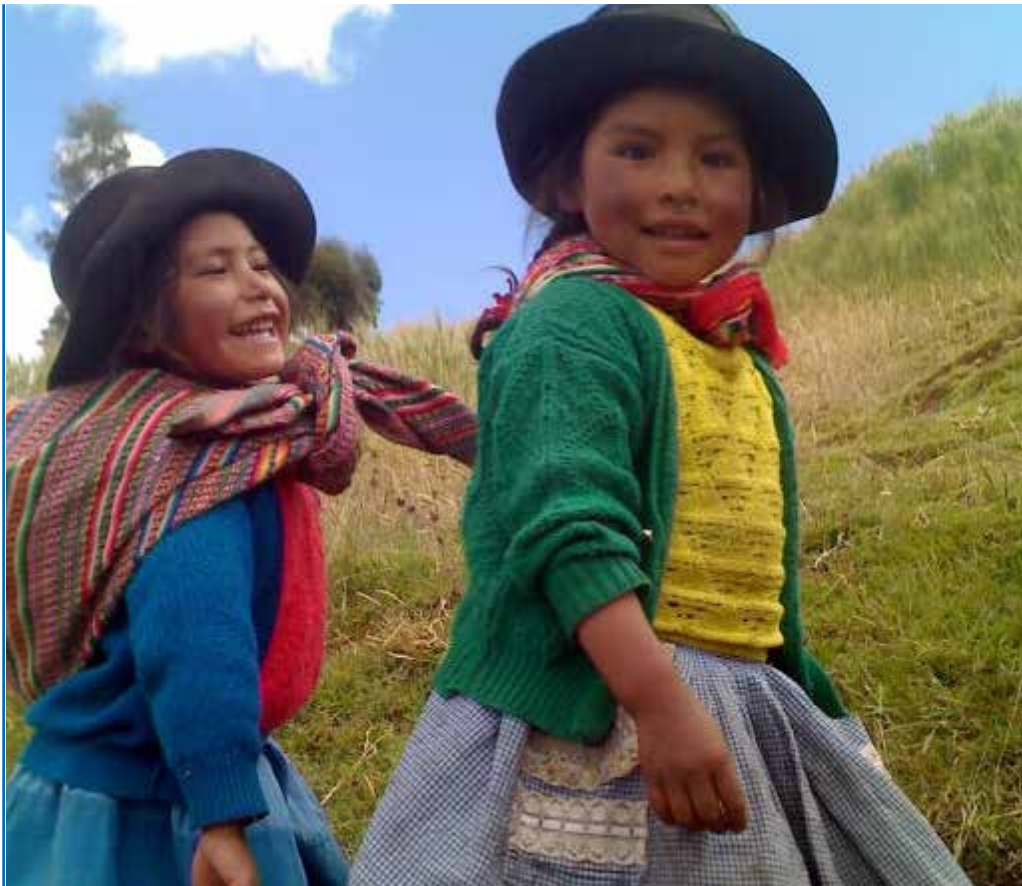
Nos preocupamos por su futuro

En sus 14 años de existencia, la MCLCP de Huancavelica ha impulsado acciones en los ámbitos de salud, educación, niñez, identidad, reparaciones para las víctimas de la violencia política, y muchos más. Esto ha sido posible, entre otras razones, gracias al liderazgo estable que ha mantenido. De esta forma, ha podido desarrollar una memoria institucional amplia, capaz de brindar aprendizajes a todas las instituciones y organizaciones que desean participar en la concertación regional.