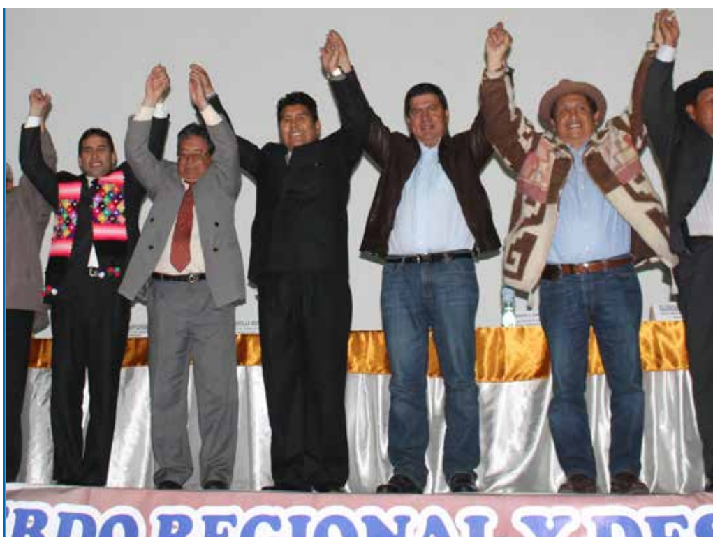
Los candidatos celebran la firma de los acuerdos

El mayor logro del proceso de los acuerdos de gobernabilidad consiste en haber insertado en la agenda política de los gobernantes temas de importancia para el desarrollo de la región. Como manifestaron varios integrantes del Colectivo, esto ha sucedido sobre todo en temas referidos a la primera infancia, principalmente la desnutrición crónica infantil y la anemia. Hasta la fecha, todos los gobiernos regionales han otorgado una atención esencial a estos temas, lo cual se explica por el compromiso que asumieron sus representantes respecto a los acuerdos de gobernabilidad.