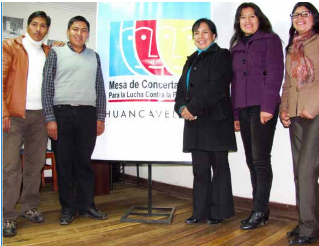
El equipo de la MCLCP de Huancavelica

fueron transcritas y analizadas. Adicionalmente, se analizaron documentos y publicaciones de la MCLCP.