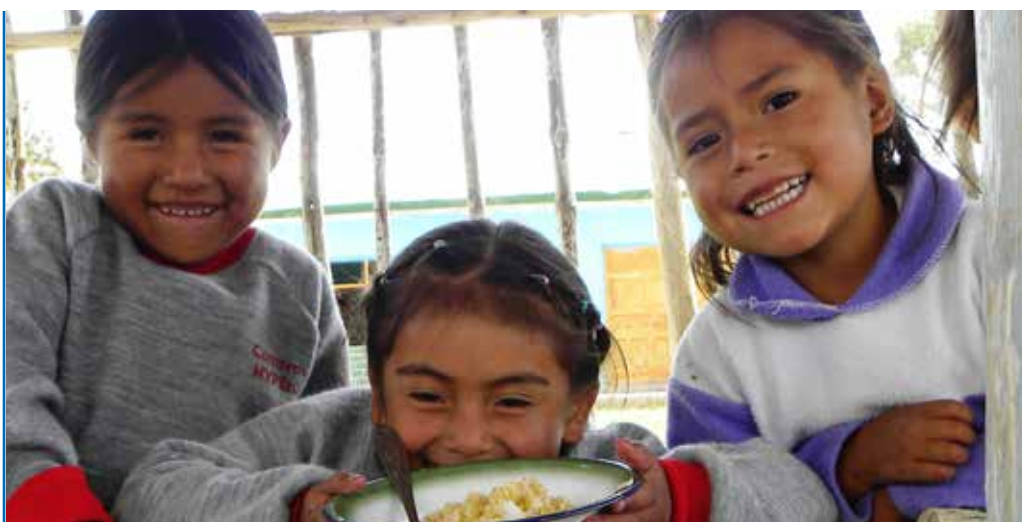
El seguimiento concertado aporta a su bienestar

El propio diseño del PAN facilita el seguimiento concertado, ya que su marco lógico es claro y estructurado. De igual manera, el responsable del MEF para el PAN en la región acompaña activamente el proceso de seguimiento concertado.