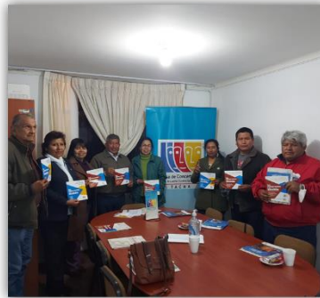
Reunión con Movimientos y/o Partidos Políticos - Recepción de aportes al AG 2023-2026 Lunes 22 de Agosto del 2022