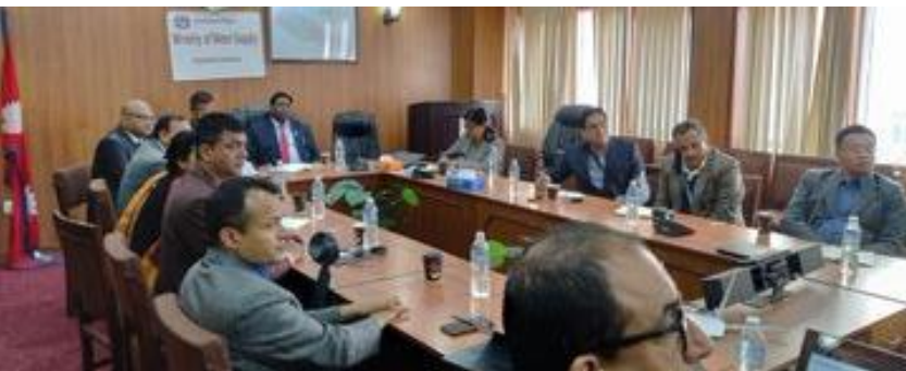
Los socios de Nepal revisan sus compromisos antes de la Conferencia de la ONU sobre el Agua 2023

Las OSC socias de SWA en Perú publican una declaración de intenciones previa a la Conferencia del Agua de la ONU 2023