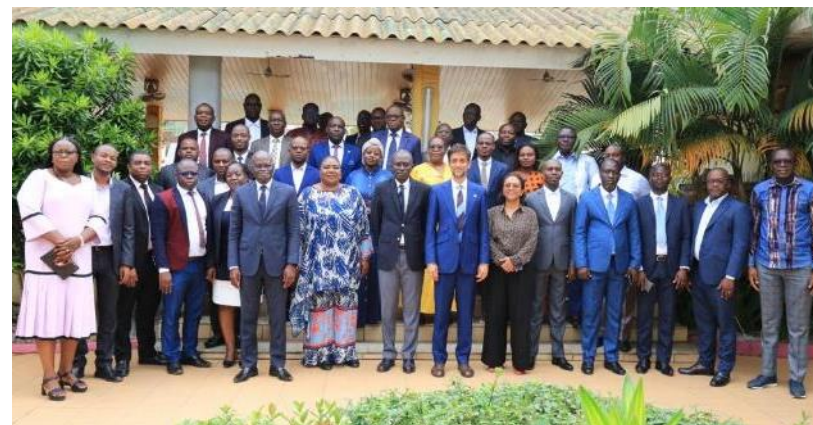
SWA y el Ministerio de Hidráulica, Saneamiento e Higiene de Costa de Marfil piden una mayor colaboración de los socios en el sector del agua y el saneamiento