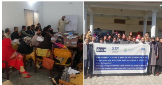
Los socios de la sociedad civil de SWA amplifican los mensajes de la alianza SWA