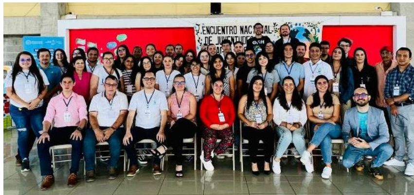
La juventud latinoamericana, socia de SWA, se prepara para la Conferencia de la ONU sobre el Agua