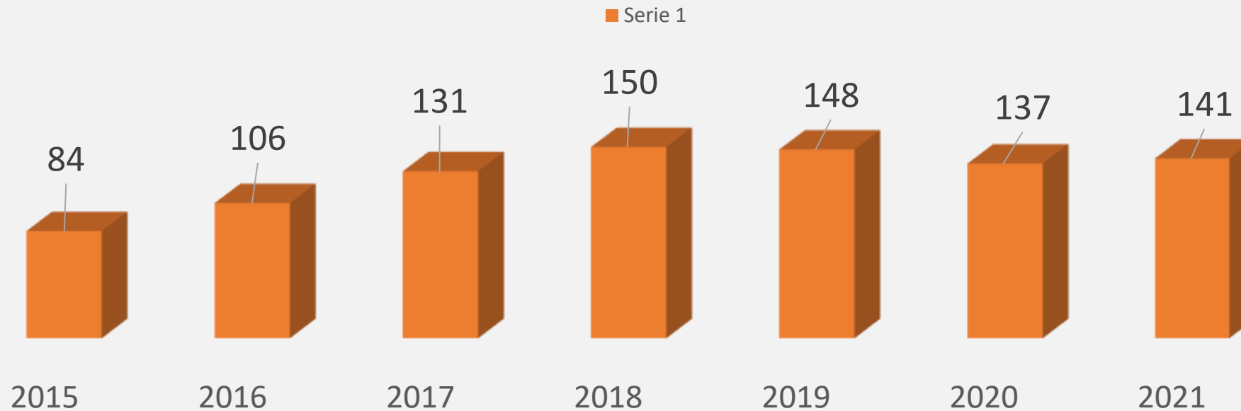
PERÚ: NÚMERO DE VÍCTIMAS POR FEMINICIDIO, 2015-2021 (valor absoluto)

Registrados por el Comité Interinstitucional de Criminalidad (CEIC)