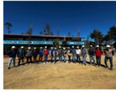
INSTITUTO SUPERIOR TECNOLÓGICO PÚBLICO HUARMACA (3 visitas a obra)