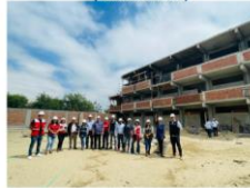
INSTITUTO NACIONAL INDUSTRIAL FEMENINO N°48 (2 visitas a obra)