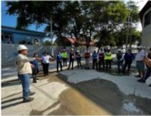
URBANIZACIÓN MIRAFLORES (3 visitas a obra)