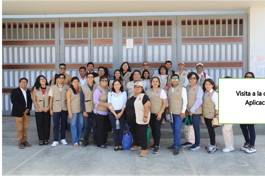
Visita a la obra. IE Aplicación.