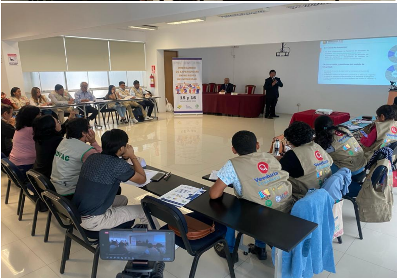
Coordinador de la oficina Regional de Integridad, Lima Región. Expone el reporte de ICP