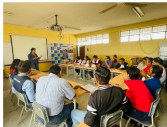
INSTITUTO NACIONAL INDUSTRIAL FEMENINO N°48