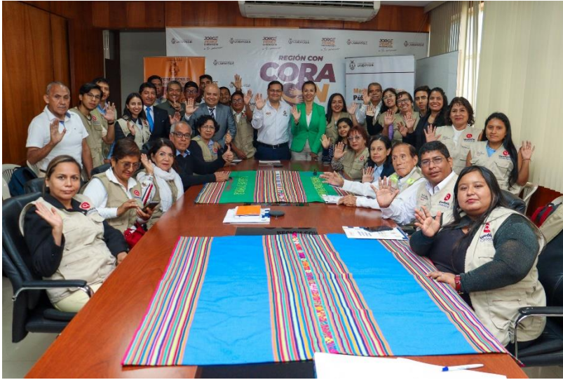
Reunión con gobernador regional de Lambayeque.